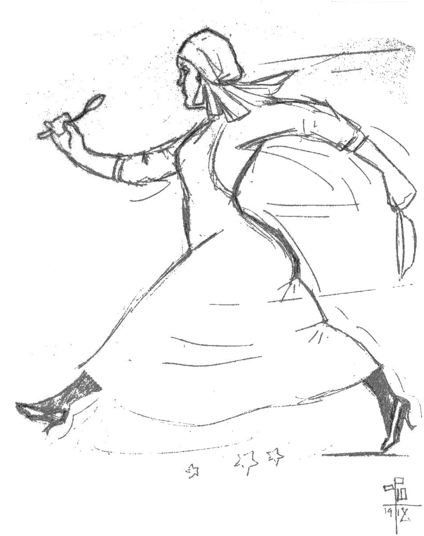
Tegnet af Olaf Pio, 1918

Det var før den offentlige sygesikring, men de lokale sygeplejeforeninger kunne ansætte sygeplejersker til at passe de syge medlemmer i hjemmet.