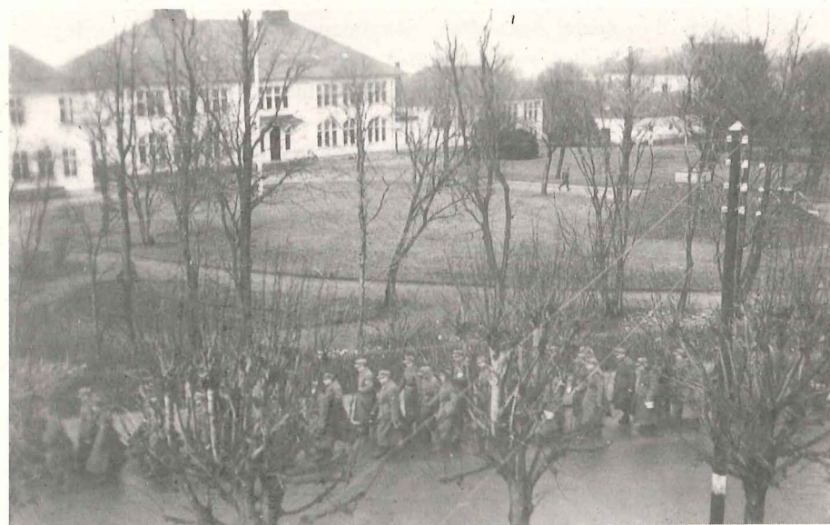
Tyske Tropper marcherer op ad Søndergade. I Forgrunden Lindetræer ved Organist Rechnagels Have. Man ser »Bunkeren« i Seminariets Anlæg i Forgrunden.

lukket op for Varmtvandsbeholderne. Jeg sagde, at de kun maatte bruge Tørv. Han, der forestod Fyringen, var ellers Varmemester i Stettin; men alle Centralapparater er jo ikke ens. De fyrede saa med Tørv og Brænde, men da jeg om Morgenen spurgte, hvordan det var gaaet, sagde han, at det var gaaet godt, men de maatte bruge en Masse Brænde og endda var Vandet næsten koldt. Jeg sagde saa, at naar der skal bade 300, kan det ikke blive stort anderledes.