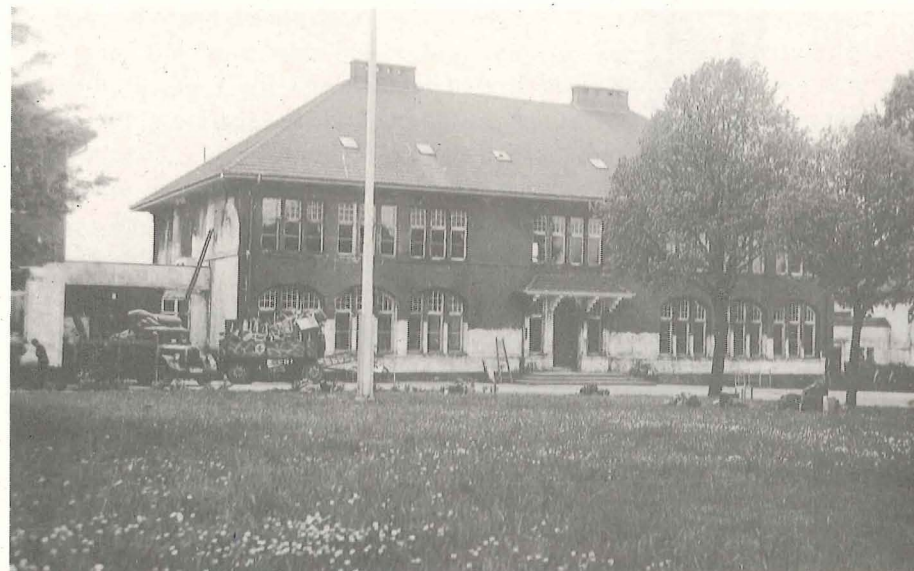
Fotografiet taget omkring 12. Maj. Tyskerne har børstet Seminariet af for neden. Paa Bilerne Sager, der skal køres bort fra Sygestuerne i Sidebygningen.