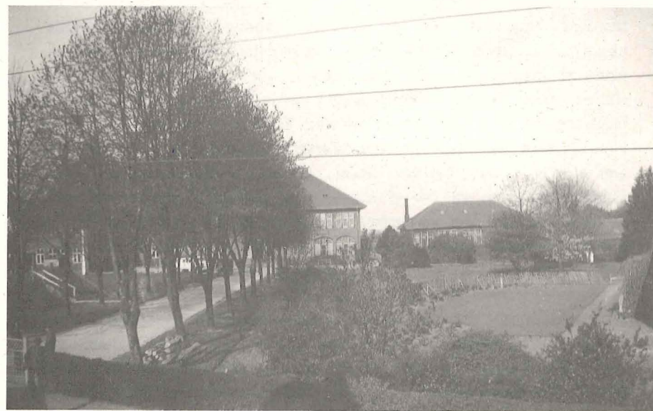
Billedet taget omkring 10. Maj. Man ser Vagten inden for Laagen og det Tømmer, der omkring 4.—5. Maj var sat op ved Indgangen til Dække for Vagtmandskabet.

Vi hejsede saa vort eget i vor Have. Jeg talte lidt om Tak til Gud og Tak til vor Konge, og vi sluttede med »Kong Kristian« og »Der er et yndigt Land«.