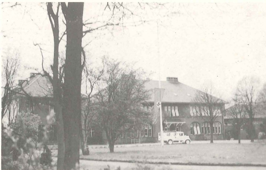
Billedet taget 4. Maj. Man ser Hagekorsbanneret paa halv Stang i Anledning af Hitlers Død. Billedet giver et godt Indtryk af Camoufleringen.

(det naaede de nu ikke paa Grund af Kapitulationen). Der var altsaa intet at gøre, og de følgende Dage fuldførtes Camoufleringen af Hoved- og Sidebygning helt op til Taget baade af Vinduer og Vægge. Læserne kan af Billederne se, hvordan det saa ud. Tillige camoufleredes Asfalten paa Traverbanen; men det blev snart slidt af ved den paafølgende stærke Trafik. I den følgende Uge gravedes der et Hul ind i Højen ovre paa Sportspladsen, og der anbragtes en Motorsprøjte med Slangen vendt mod Seminariet, — alt tydede paa Kamp. Hvor maa vi være taknemlige, at det blev til Kapitulation