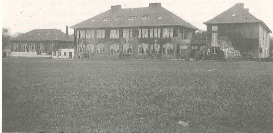
Billedet taget omkring 12. Maj. Seminariet set fra Vest (Sportspladsen). Lidt af Camoufleringen børstet af Gymnastiksalen. Nogle Soldater ses ud for Sidebygningen.

Om Fredagen kom der en Del let saarede og blev indkvarteret i Sidebygningen, og om Eftermiddagen kom 12 Læger til Forhandling om deres Anbringelse. Vi enedes om, at de skulde have den nye Bygning med Undtagelse af Pedellens Lejlighed. Vi skulde saa have den gamle Bygning, Gymnastiksalen og Omklædningsrummene. Det knob for de nye at lade det, som de tidligere Tropper havde efterladt, være i Fred. De brød flere af Laasene itu og endevendte, hvad der var bragt i Orden flere Steder. Samme Dag havde vi ogsaa Besøg af nogle Frihedskæmpere, der skulde efterse Loftet paa